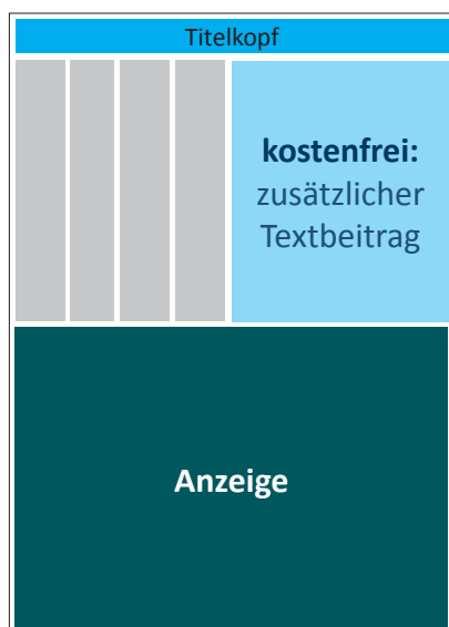
1/2 Seite quer H 264 mm x 8 Spalten (375 mm)